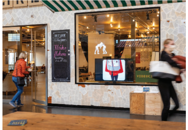
Standortaufnahme im Wohnzimmer der Markthalle Basel mit einem Video von Shae Myles und Anxiong Qiu.